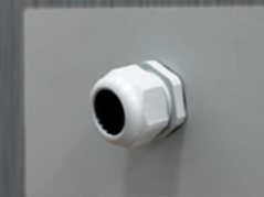
Conectores glándula para cable de conexión M32/M40