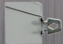
Soporte de fijación a pared