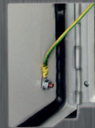
Puesta a tierra