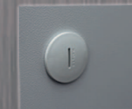
Tapón p/ orificio de conexión M32/M40