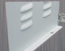
Rejillas de ventilación. Sujeción a piso