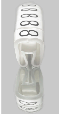
Similar a la ilustración